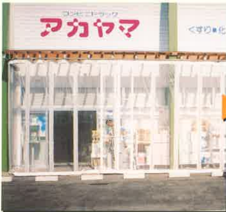
1.閉じればコンパクトな収納スペース。