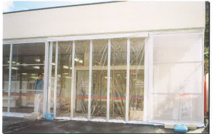
■あらゆる建物への取付が可能!しかも取付簡単!