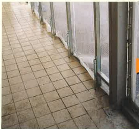
簡単操作の落としピンタイプ。(閉時)