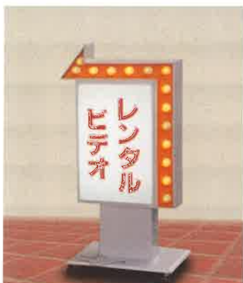
2.電飾看板(スタンド)