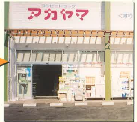
3.フルオープンで、スペースを有効利用!