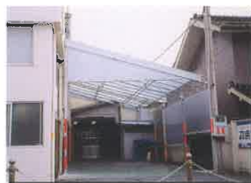
固定テント(雨除け)