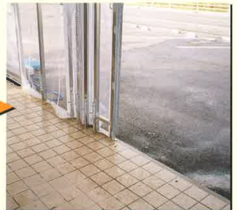
簡単操作の落としピンタイプ。(一部開放時)