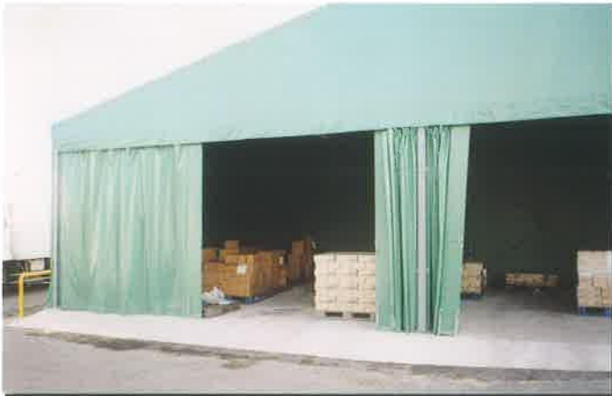
■カーテン式だから倉庫内も左右いっぱい使用可能!