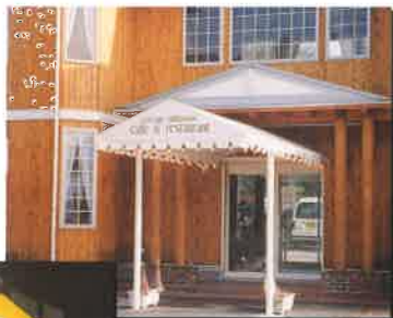
アプローチテント