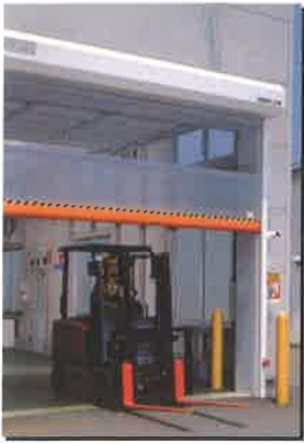
車両の通行もラクにこなせる!

通常シャッターの約10倍(0.8m/秒)の速さの開閉が可能!フォークリフト等の出入りの多い工場に最適!!