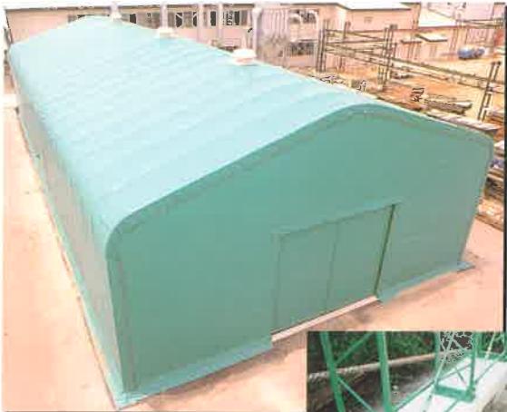
■積雪に耐える高強度設計。

低価格、短納期を追求した倉庫!!使用目的に合わせた使いやすいテント倉庫を提案します。