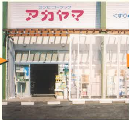
2.必要に応じて一部開閉(固定可能)が自由自在!