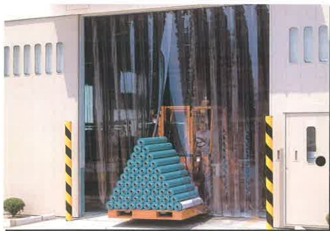
■フレキシブルカーテン (保温・保冷・防音・防塵・防風・防虫に効果を発揮!!)